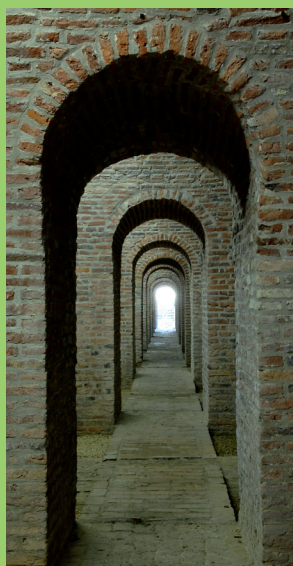
Kazematten van Menen.

Speciaal voor leerkrachten 5de en 6de jaar basisonderwijs, 5de en 6de jaar secundair onderwijs (Duits en geschiedenis) en avondonderwijs Duits. Uiteraard zijn ook andere geïnteresseerde leerkrachten van harte welkom.